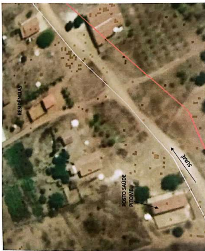
PLANTA DE SITUAÇÃO MUNICÍPIO